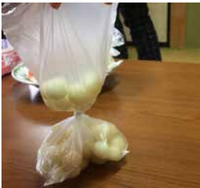
下が予め入っていた団子、袋を一度縛って上にお供えした団子を入れる。