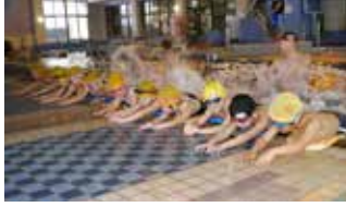
ケアハウス津南水泳教室

いよいよ3月も終わりに近づき卒業、入学シーズンを迎える時期となりました。今年度のTapは春からケアハウス津南の指定管理者となり、今まで以上にたくさんの皆さんと教室やイベントを通じて「つながり」を持つことができました。新年度も「つながり」を大切にして、仲間づくり、趣味づくり、健康づくりのお手伝いをさせていただきます。 現在、Tap及びケアハウス津南では会員を募集していますので、春の到来に合わせて、健康づくりや趣味づくりを始めたい皆さんか。総合センターでの教室は4月3日(月)から教室を開始します。