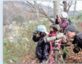
バードウォッチングの様子

冬鳥と夏鳥の入れ替わりのこの時期は、さまざまな鳥を観察できます。一緒に野鳥を観察しませんか？