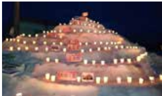
キャンドルに照らされた河岸段丘