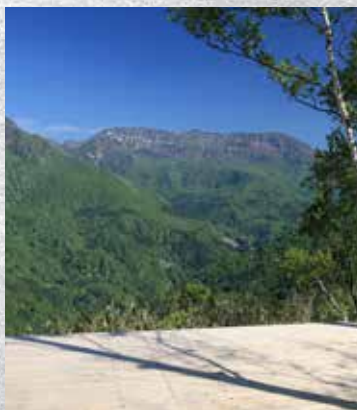
鯨の背のような苗場山 前倉トド展望台より

苗場山は、約30万年前に形成された成層火山です。大きく4回の噴火があり、第2回目の噴火の溶岩は、約13 km離れた龍ヶ窪の近くまで達しました。 江戸時代 鈴木牧之は苗場山に登り「絶頂一里千勝万景」と『苗場山記行』の中で絶賛しています。平坦な山頂付近に広大な高層湿原が広がっている様子を見てそう記したのです。山頂がどのように平坦な山は日本では珍しく、標高1800mの山頂の湿原には、およそ3000ヶ所の池塘が点在しています。この池塘は、近年の堆積物調査によると、約7,000年