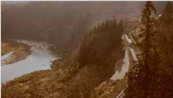
つなGO!プロジェクトのフェイスブックページもあります。みんなで編集会議の様子も随時アップしていますので、いいね!をよろしくお願いします! https://www.facebook.com/tsunagotsunan