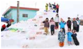
河岸段丘の雪像完成♪