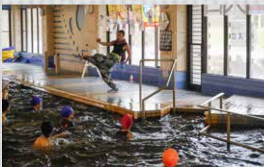
クアハウス津南のアクアリズム♡♡♡