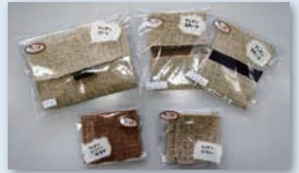
ならんごしの会が作ったアンギン商品

ぜひ、あなたも一緒に活動しませんか？興味をお持ちの方は、なじよもんまでご連絡ください。