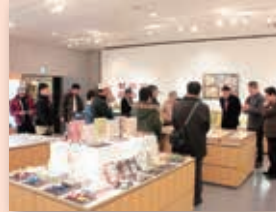
昨年のレセプションの様子

会期 / 2月4日(土)～3月4日(土) 入場料 / 無料 様々なコレクションが、なじよもんに集結します。驚きに満ちたコレクションの数々を、どうぞお楽しみください。 <レセプション> 2月4日(土)10:00より、出展者にコレクションの紹介をしていただきます。どなたでもご参加いただけますので、お気軽にお越しください。