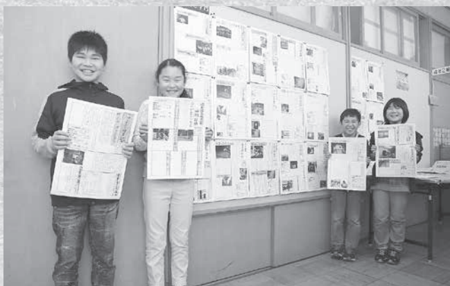
私たちの新聞を見に来てください!

新聞を作る際も、目をひく見出しの付け方などを新聞記者に教えていただき作りました。写真や温泉の効能、温度、湧出量や入浴料金などの基本データも掲載されているとても読み応えのある新聞です。 このPR新聞は、3グループに分けて役場ロビー、なじよもん、クアハウスにて巡回展示しています。皆さん、ぜひ新聞を読んで感想を聞かせてください。そして気になる温泉があったらぜひ行ってみてください。 そして、2月23日(木)の午後2時から津南小学校体育館にて、温泉調査隊の動画やPRソングの披露をする予定で準備をすすめています。皆さんぜひお越しください。