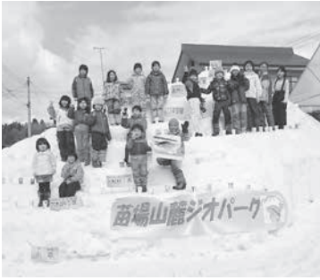
今年もたくさんの笑顔があふれる津南を目指します。

本年もTap理念である「つながり」を大切に笑顔あふれる楽しい活動をしていきますので、Tapを何卒よろしくお願いたします。