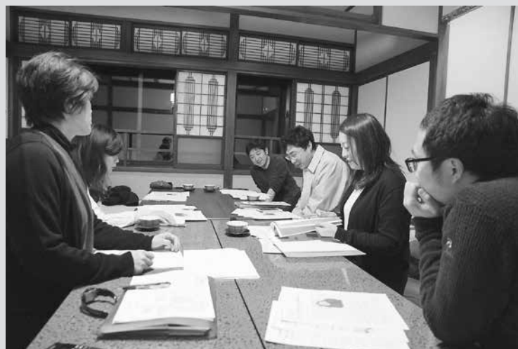
つなGO!プロジェクトのフェイスブックページもあります。みんなで編集会議の様子も随時アップしていますので、いいね!をよろしくお願いします! https://www.facebook.com/tsunagotsunan

しかし世界でも有数の多雪地域である津南町は、古来から雪と共生してきた歴史があり、そこで育まれた知恵や工夫、恵みもたくさんあります。ここに住む人にとっては当たり前でも、よそから見たら特別だったなんてこともありますよね。テレビは「雪が多く降ること」をニュースとして報道していますが、移住者の私からすると、本当のニュースは「そんな