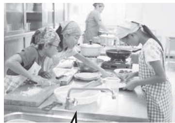
みんなで協力して頑張りました。

心も体も元気に健康で過ごすために大切なポイントは、生活リズムを整えることです。「早寝・早起き・朝ごはん」を心掛けていきましよう。