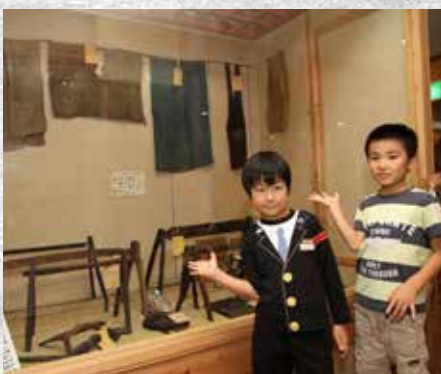
アンギンの服や前掛け、アンギンを編む道具を見ることができるよ!