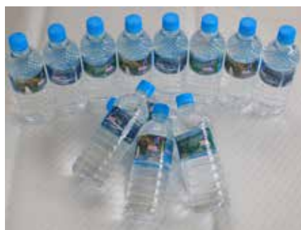
(株)大阪屋商店様 (津南の天然水)