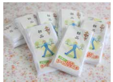
(有)津南印刷商事様 (タオル)