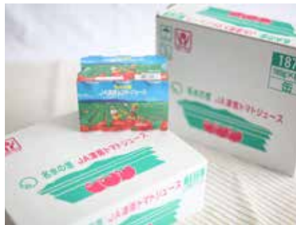
J A津南町様 (津南トマトジュース)