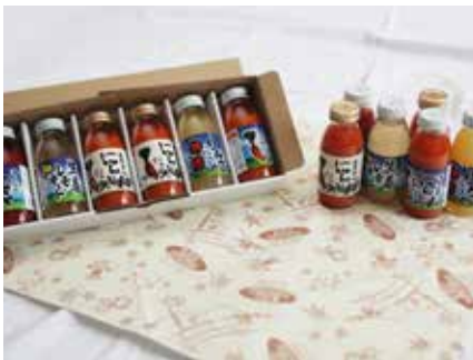
津南観光物産館様 (にんじんジュース等詰め合わせ)