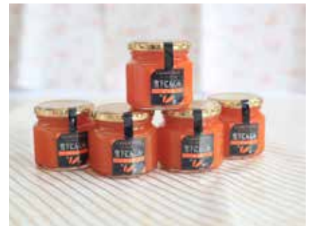
津南町森林組合様 (雪下にんじんジュレ)