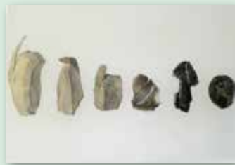
下も原I遺跡と居尻A遺跡の遺跡間接合資料

津南段丘を舞台に活動した人 類の歴史は、およそ3万年前まで さかのぼります。氷河期でもあ る旧石器時代の資料を、津南町 から出土したものを中心にご覧 いただきます。