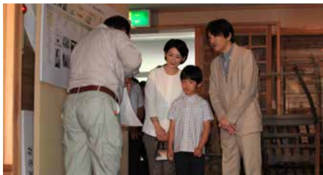
↑ 歴史民俗資料館で雪国の暮らしについて説明をうけられました