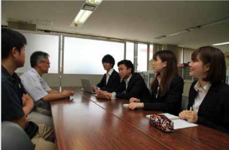
つなGO!プロジェクトのフェイスブックページもあります。みんなで編集会議の様子も随時アップしていますので、いいね!をよろしくお願いします! https://www.facebook.com/tsunagotsunan

ここ津南においても、9 月24日〜25日に「公共政 策フォーラム2016 in 津南」が開催されます。全 国20の大学の学生が津南 に集い、「みんな雪のおか げ」というテーマで政策を 出しあってその優劣を競 います。雪国にずっと住ん でいると、ついつい雪の大 変な面ばかりに目がいき ますが、このフォーラムで は「雪の恵み」に着眼した よそ者、若者ならではの 提案が期待されます。町 民の聴講もできますので、 この機会に新しい視点に 触れて、刺激をもらって みてはどうでしょうか。