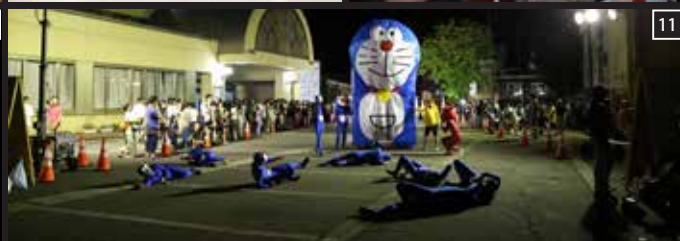
①ツリークライミング②5cmの綱渡りスラックラインに浴衣で挑戦 ③ステージイベントに参加して豪華賞品をゲット④十日町・津南で活躍するダンスグループDSS⑤ラムネ早飲み競争⑥つなん火焰太鼓⑦中等生もゴミの分別のお手伝い⑧民踊流し先導は秋山太鼓⑨竜神太鼓⑩錯覚ダンス⑪津南を盛り上げるS56⑫最後は音楽とあわせて打ち上げるシンフォニー花火