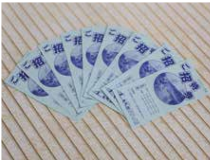
竜神の館様 (温泉入浴ご招待券)

この事業に取り組んだ町民のみなさんの励みと継続につながるよう、町内の事業所のみなさまから景品のご提供をいただきました。大変ありがとうございました。景品は、今回と秋の2回に分け、抽選で参加者のみなさんに進呈いたします。