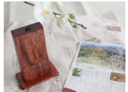
山源木工様 (木製一輪挿し)