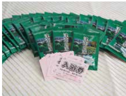
ニュー・グリーンピア津南様 (温泉入浴ご招待券・入浴剤)