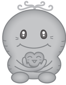
津南町認知症見守り 支援マスコットにんこっこ

津南町の認知症見守りキャラクター「にんこっこ」も、イラストは白黒ですが、オレンジ色です。その他にも、「オレンジブラン」「オレンジカフェ」など、オレンジ色は認知症関連ではテーマカラーとなっています。