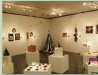
昨年のクリスマス展の様子

28日午前10時からのレセプションでは、出展者に作品の紹介をしていただきます。お茶とお菓子をご用意してお待ちしています。お気軽にご参加ください。