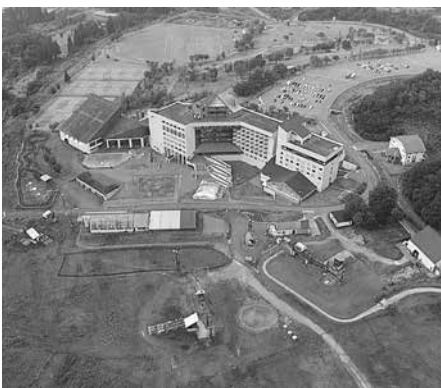
10年間の契約を更新したニュー・グリーンピア津南

新たな契約では、一部、契約内容の見直しを行い、大規模な改修、修繕が必要となる場合は、所有者である津南町が行うこととなりました。このための財源として町は基金条例