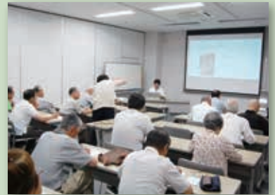
前回の講座の様子