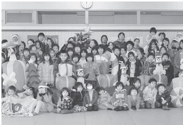
みんなでクリスマスを楽しもう！