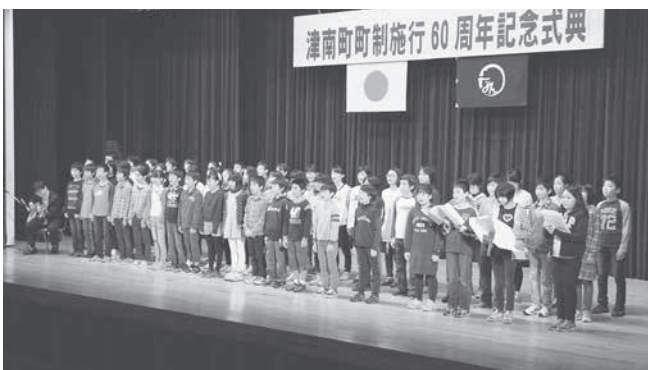
津南町、栄村の小学校6年生によるジオパーク PR ソング Takaramono の合唱が行われました。