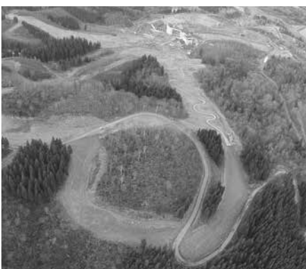
ゲレンデも一部、新たに整備された (写真下部)

またこの冬の運行をめざし、リフトの新設やゲレンデの整備を行います。より親しまれやすいファミリールーゲレンデ、競技用ゲレンデとして使用していく予定です。