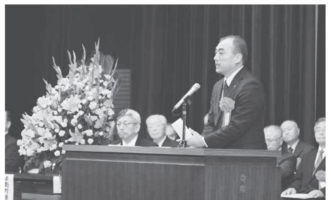
あいさつをする小谷野剛（こやのつよし） 狭山市長（友好交流都市）