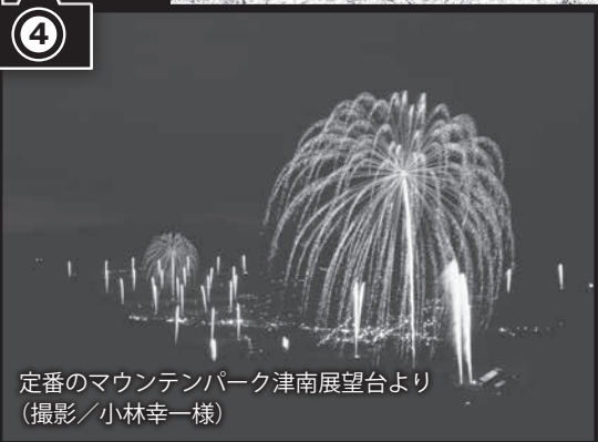
定番のマウンテンパーク津南展望台より

31日(出夜)7:00ちょうど、ジオ1の長野県栄村の切明をスタートした花火(虎の尾)は2秒おきに点火。中津川が信濃川に合流するジオ23まで、一気に駆け下りました。