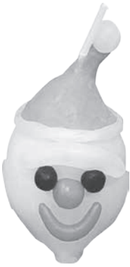
手で温めてコネコネ♪ 手作りキャンドル♪