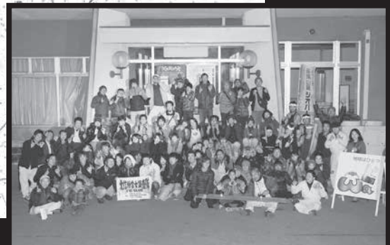
打ち上げスタッフ集合写真