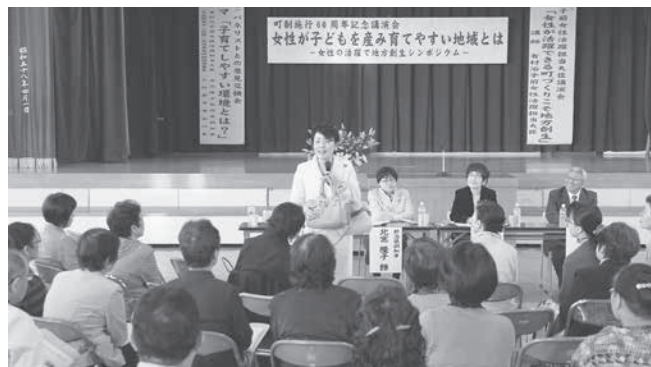
マタニティマークの普及拡大に力を入れてきた