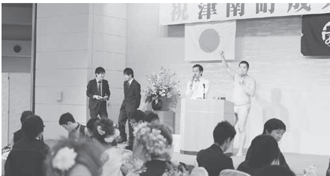
ゲストのお笑い芸人も恒例のビンゴ大会を盛り上げました