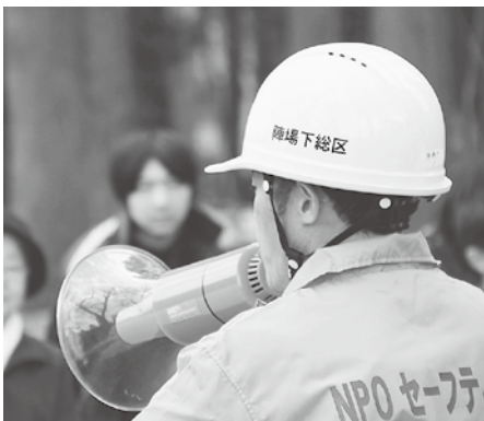
災害は突然やってきます 日頃の備えが大切です