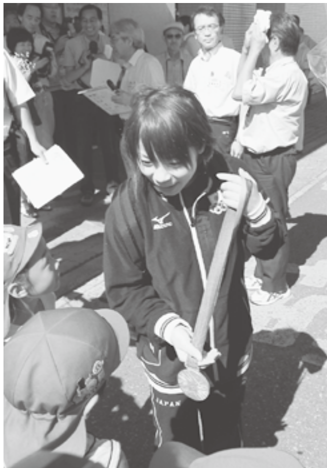
↑ ひまわり保育園の子どもたちに銀メダルを触らせてくれました。

ロンドンオリンピックの女子重量挙げ種目に出場し、銀メダルを獲得した三宅宏実選手が津南町にやってきました。毎年、女子重量挙げの合宿をニュー・グリーンピア津南で行っており、今回も、オリンピック後初の合宿を行うために津南町を訪れました。