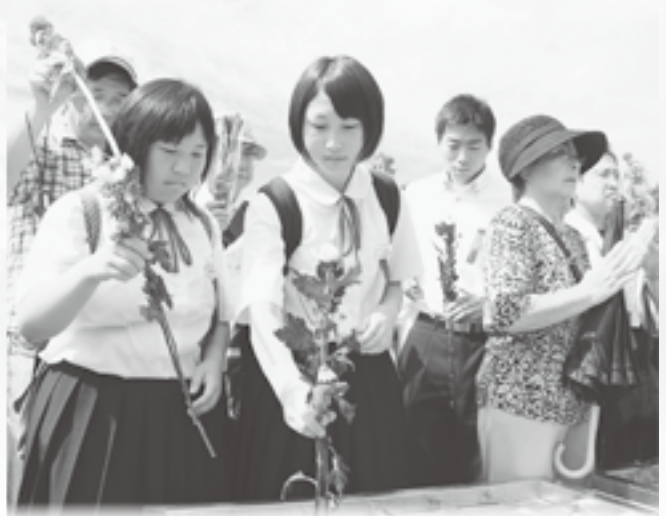
平和祈念式が終わると、献花をする人々の長い列ができる。派遣団も恒久平和への願いを込め、慰霊碑に花をささげた。列には、学生だけでなく、外国人の姿も多くみられる。