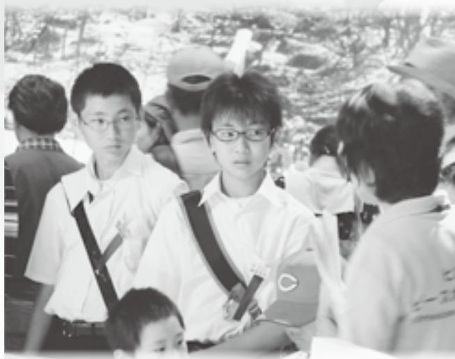
平和記念資料館で、ピースボランティアから当時の様子を聞く派遣団。 広島では、当時、度重なる空襲による民家の延焼を防ぐため、あらかじめ建物を壊す「建物疎開」を行っていた。この建物疎開には、中高生が労力として動員されていたため、たくさん子どもたちが亡くなったといわれている。