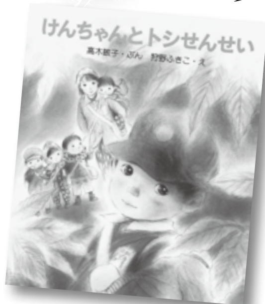
けんちゃんとトシせんせい 高木敏子・ぶん／狩野ふきこ・え 金の星社／出版

その後、戦争孤児になってしまったけんちゃんは、津南の親戚に2年間引き取られた後、横浜で暮らしていました。一方、福知先生は、けんちゃん疎開先での出来事が忘れられず、その