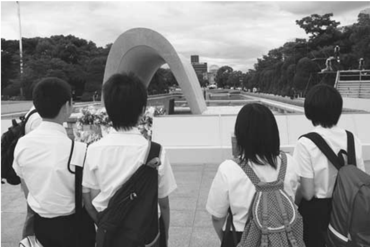
平和記念公園の原爆死没者慰霊碑から原爆ドームが見える。骨組みばかりの建物が私たちに語りかけてくるようだ。