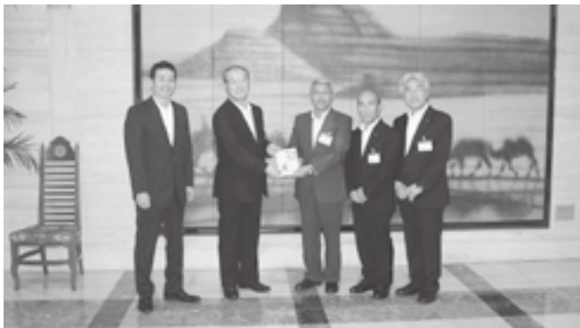
↑ 日本食研(株)本社での贈呈式

日本食研(株)から小中学校へ100万円分の図書が寄贈されました。なお、日本食研(株)からの図書の寄贈は今回で4回目となりました。いただいた図書は各小中学校の日本食研文庫に展示して子供たちとたいせつに使わせていただきます。ありがとうございました。