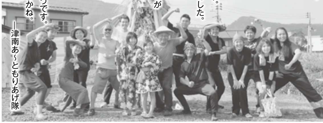
津南あくともりあげ隊