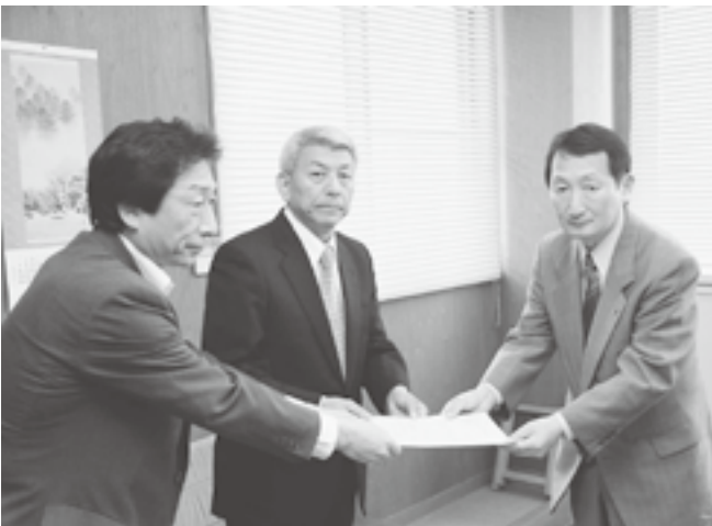
↑ 町商工会長に来春卒業生への就職先確保の依頼をする津南町長とハローワーク所長

ハローワーク十日町の調べによると、来春の地元就職希望者が、昨年の同時期と比較し増加していることがわかりました。