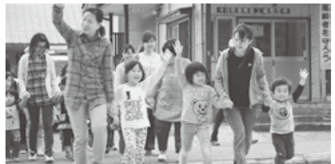
↑ 手をあげて横断歩道を渡る子どもたち(上郷保育園)

各保育園での幼児と保護者を対象とした幼児交通安全教室が開催されました。子どもの頃からしっかり交通ルールを守って、事故にあわないよう注意しましょう。