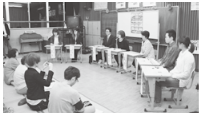
↑ 行政説明だけでなく、若者の意見を聞く場を設けた中津地区

「強くて、やさしい子」を育てることを目標に、昨年度から動きはじめた津南町教育委員会。その方針説明会を地区ごとに行っています。5月15日に中津小学校で行われた懇談会では、20代の若者の意見を聞く場を設けました。参加者の中からは「若者の意見を出せる機会が少ない」という声も聞かれました。この懇談会は、今後も学校区ごとに行われていきます。