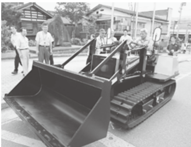
↑ 1年間無償で貸し出されたショベルローダー

株式会社諸岡 もろおか さまから、小型ショベルローダーを1年間無償貸与されることになりました。これは、昨年度の豪雪の様子をテレビで知り、小回りのきく同社の機械を役立ててほしいということで実現されたものです。ありがとうございます。