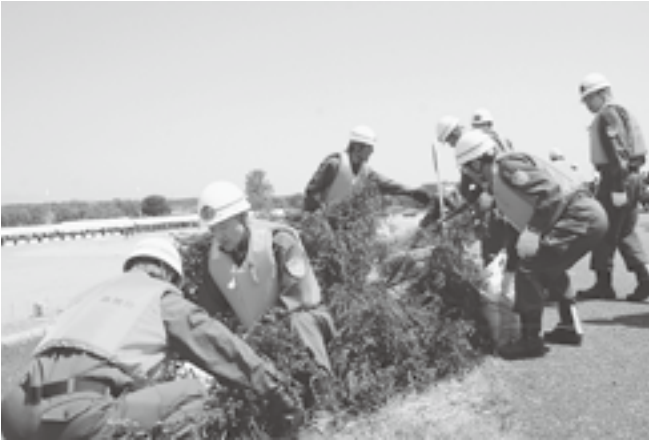
↑ 長岡の大手大橋脇の河川敷で木流し工法訓練をする町消防団員

河川流域の市町村、国県の機関が連携して行う大規模な水防演習に津南町消防団も参加しました。