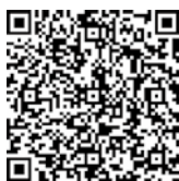
人事院 採用情報 NAVI