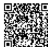
労働保険電子申請 特設サイト