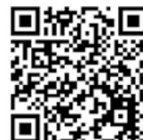
年度更新申告書 書き方パンフレット

労働保険のお手続きに「電子申請」を是非ご活用ください！ (自宅やオフィスから24時間いつでも申告・納付が可能です。)