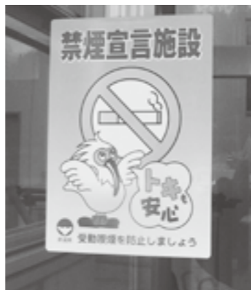
↑玄関に貼った禁煙宣言施設ステッカー

現在は、毎年1回各人のパソコン上または紙面にて57項目の質問に答えて、ストレス診断がされます。前年度のデータ