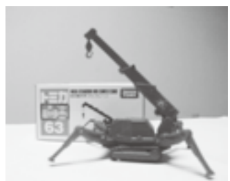
↑「目指せ！チーム100万歩」の賞品として提供いただいたカニクレーン（トミカミニカー）には、ネオックス社製品が使用されていますよ。

■連絡先／津南町役場 福祉保健課 健康班 TEL.765-3114 内線(138・139)