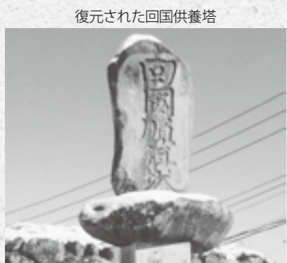
復元された回国供養塔