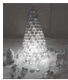
小学生の時、図工と音楽は「2」でした