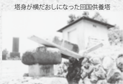
塔身が横におしになった回国供養塔

たくさん石造物が倒れていましたが、破損したものはごく少なく安心しました。破損しなかったのはなぜか。いろいろな考え方がありましようが、ひとつの考えとして、当日の積雪19.6cmが石仏の破損を守ったと考