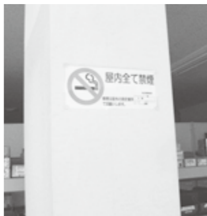
↑工場内に貼っている禁煙表示ステッカー

と比較して心の状態がどのように変化しているか比較することが出来ます。また、引き続きストレス学習を行い、ストレスへの気づきと対処方法について学んでもらっています。