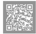
国税庁経験者 採用試験