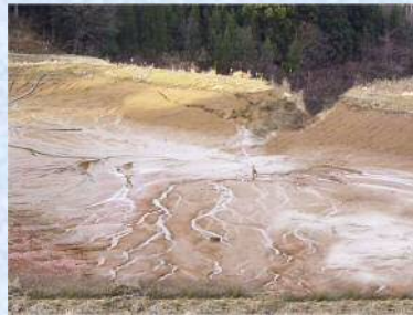
被災したため池(新潟県中越地震)

激しい豪雨により大・小含め、約240箇所の農業用ため池が堤防決壊などの被害を受けた。