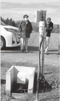
水田自動給水装置 センサー付

今後町は、計画策定し、農家負担額見直しや支援策など整備後の安定運用が可能か見極める。整備に意欲ある農業者や集落に対して推進して行きたい。