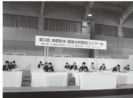
津南米・食味コンクール

回答 新たな地域の洗い出しを行うとともに、担い手への説明会等を開催する。町農業振興基金の有効活用方法、併せて償還金等受益者負担軽減策を検討する。