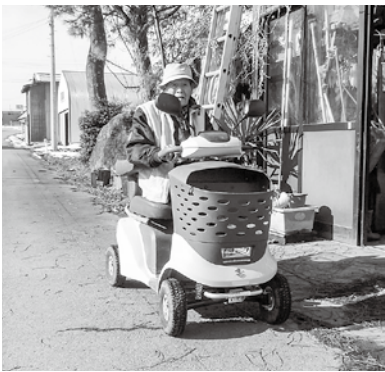
春を待つシニアカー

町長 当町では行方不明者が出た場合、心当たりの場所を捜索しても見つからない時は警察に相談するよう伝えている。また町に相談があった場合、家族の同意があれば広報無線や防災メールで広く情報を提供して発見につながるようお手伝いしている。