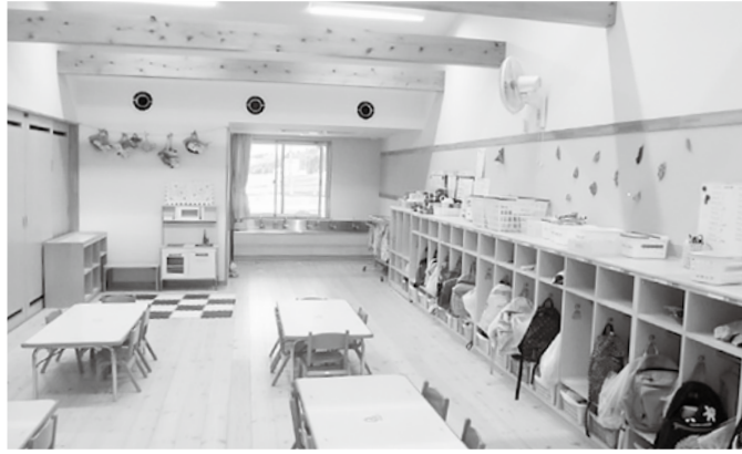
あおの森保育園 保育室

いことになるので、遊具は置いていない。皆で工夫した遊びを考えている。 この様に随所に園長や保育士の思いが入っていて大変勉強になりました。