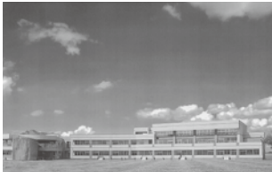
ひまわり保育園予想図