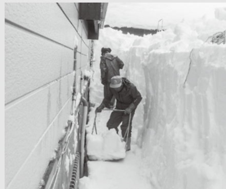
屋根除雪後の雪処理も重労働だ

問 過疎化、高齢化が進む中、除排雪の担い手は、自助共助で対応できなくなっている。豪雪地において安心して暮らし続けられる条件整備がいま待ったなしである。町で除排雪対策チームを作っては。 町長 除雪要員を確保することが難しいことや屋根雪除雪を生業とする業者、個人がいるので、十分研究が必要と認識している。他の自治体事例や除雪関係者の意見も参考にしながら、除雪券対応の継続も含め、町全体としての雪処理対策を検討していく必要があると考えている。 問 雪が降り続く日は、帰宅時集落に入れないほど町道に