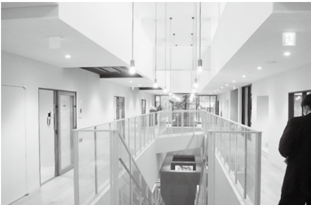
愛宕幼稚園 2階保育室と吹き抜け