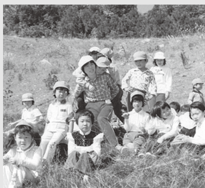
仲よしハイキング

町長 第7波は主に夏休み期間中で、特に生活の乱れがあったとの報告は受けていない。いじめの認知件数はあり、対応している。