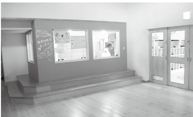
あおの森保育園 玄関と調理室