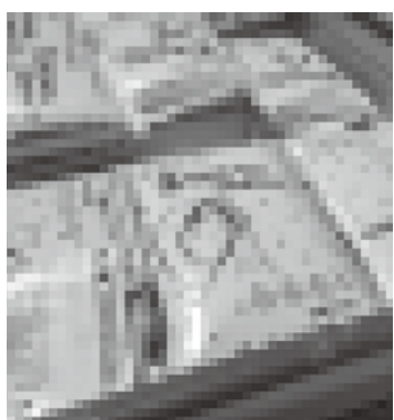
値上げが続く肥料

農林振興課長 肥料高騰対策事業についてはJAにおいて12月中に5回説明会を開く。補助対象者には12月に申告書を発送し、補助金の交付は2月頃を予定している。