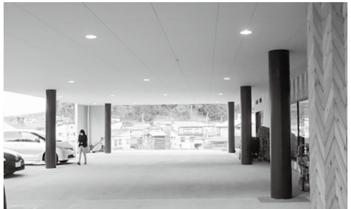
愛宕幼稚園 広い玄関ピロティー(雨雪でも楽に送迎)

議員定数等特別委員会では、昨年秋から11回の会議の他、町民アンケート調査や懇談会等を開催し、議論を重ねてきました。次の通り報告します。