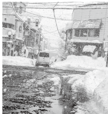
令和4年2月6日R117号と病院行交差点風景

回答 町道除雪体制については、除雪機械・消雪施設（消雪パイプ）の更新や直営での機械除雪路線と委託路線を適切に組み合わせ対応する。集落の要望については、降雪状況によるが、適切な除雪作業ができるよう対応する。