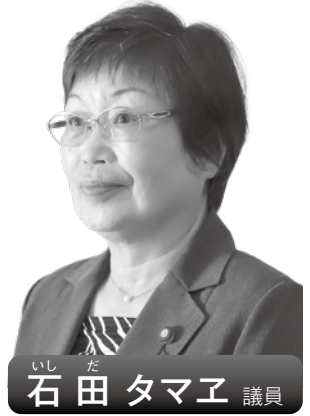
石田 夕馬 議員