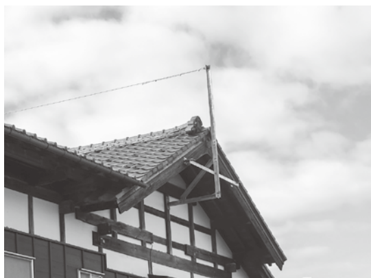
屋根除雪用安全器具風景

組んできている。高齢者・子育て世帯に10万円を上乗せして限度額20万円としてきた。制度の一部見直しに着手する。