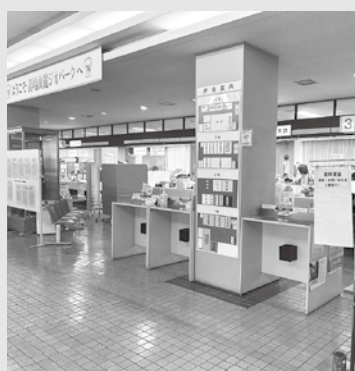
まちづくりには1人1人の力が必要