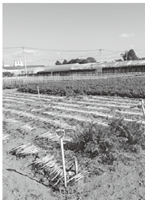
くにさだ育種農場