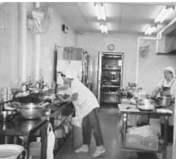
保育園用務員さんの仕事はいろいろ

支給と安心して仕事に専念できるように契約期間の延長を強く要望する。 助役 現在非常に労働情勢の厳しいなかで、町民の多くが職を求めており、できるだけ多くの町民を雇用できるように道を開いていかなければならないという基本的な考えがあるなかで、特定の人を固定して雇用すると、一方で職を求めている町民の道を閉ざすことになりかねない。また、地方公務員法の制約もある。退職金については委託職員の委託金のなかで配慮してあるつもりだが、お金で労をねぎらうのは困難であり、何らかの形で労をねぎらうことを考えたい。