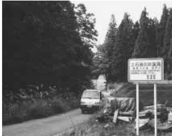
風景ではありません、常に注意を!

町長 本年度津南町地域防災・震災対策編の見直し事務を進めている。でき次第お知らせし、町民の防災意識高揚を図り、啓蒙、避難対策を実施する。森林火災については、広大な森林を有する町として不測の事態は大惨事が懸念されるため、春先、山火事防止月間において、看板等で注意を呼びかけている。