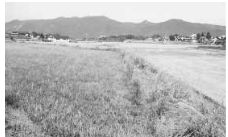
雑草が生い繁る減反農地

町長 本年度の生産調整は農家の理解と協力を得て100%達成できた。新たな米政策のなかで農業者、農業団体に主体的な手上げ方式を模索し、転作可能面積のアンケートを実施した。休耕面積390haに対し、作付け可能面積は200haであった。よって減反