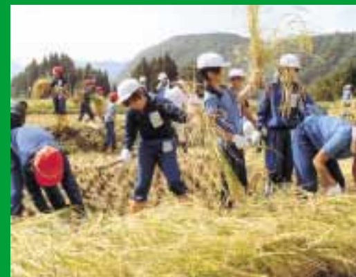
稲刈りをする中津小の児童