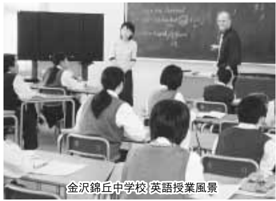
金沢錦丘中学校 英語授業風景