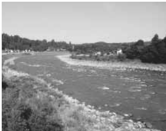
歴史を見つめる信濃川

信濃川の国土交通省直轄編入を 町長 飯山市から中里村間の39・65kmが中抜けの県管理となっている。一貫して国が行うべき河川である。直轄編入の実現のため飯山市、野沢温泉村、栄村、中里村、津南町で連絡協議会を設立し、国県に強く要望している。