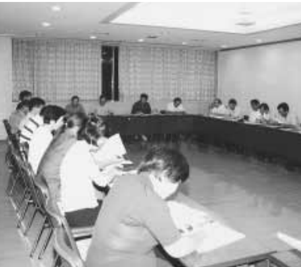
住民代表との自律推進会議

問 今年に入り急に合併を前提とした協議会設置の動きが取りざたされ、既に町、議会共に自律を決め、職員による自律プランの説明会もされ、住民代表と最後の詰めに入っているなか、町民を迷わす行為と思われるがいかがお考えか。 町長 いまいろいろ取りざたされているが、我が町が自律に向けた取り組みは当初からいささかも揺るぎないもので、新生津南町は自律に向けた町づくりに、計画策定とその実現に向け邁進するものである。