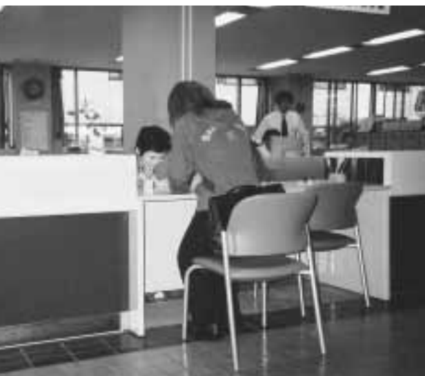
ローカウンターでやさしく応待

町長 全国的には住民投票条例を制定している自治体は増えてきている。議会制民主主義のことも含め、委員会で十分議論するよう推進室に指示する。