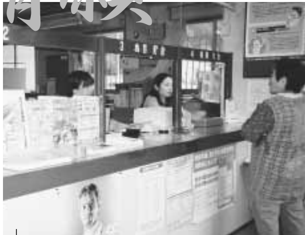
地域住民にとって大切な郵便局