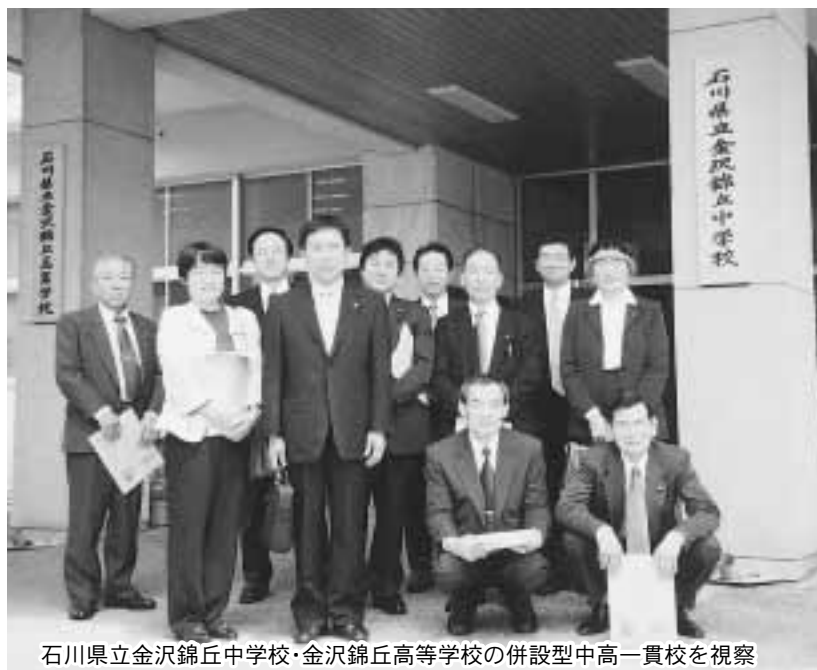
石川県立金沢錦丘中学校・金沢錦丘高等学校の併設型中高一貫校を視察