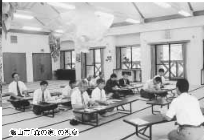
飯山市「森の家」の視察

た。翌日は飯山市なべくら高原「森の家」の視察を行い、農業と観光を一体化し、自然農村体験をテーマとしたグリーンツーリズムの取り組みなどを伺いました。委員会として今後の検討課題の一つと思われるものでした。