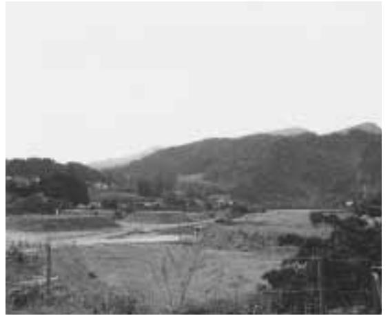
残土が積み重ねられている運動公園

問 夢ある運動公園整備計画が、商工会青年部、スポーツ振興協議会、他の団体から提案されている。芝生をもった運動公園は、生涯スポーツ、子供達の教育、育成の場として必要な施設と考える。整備計画と時期はいつ頃になるのか。整備に向けて、準備委員会を立ち上げられないか。 町長 大倉トンネル工事の残土処理場となっているため、町民の皆さんに迷惑をおかけしている。この秋トンネル工事の入札が予定されており、来年春から工事中の予定。かなりの年月が予想されるが、一日も早い貫通を望んでおり、国県に要望している。整備計画は、原形復帰の目処がつけば、提案頂いた団体と相談していく。