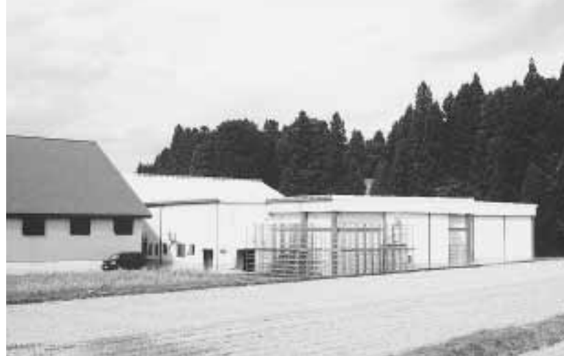
森林組合きのご施設雇用の場確保に貢献