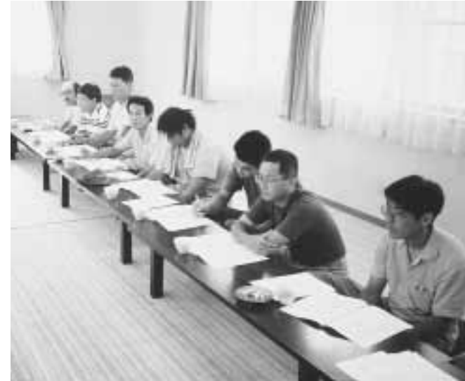
農業に夢をたくす新規就農者

町長 前々から明確にしている。この考え方は変わるものではない。新生津南の構築に向け一層の協力を賜りたい。