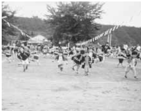
ぼくたちのパワーをみて! みて!!

問 次世代育成対策推進法が制定され、自治体は、子育て支援の「行動計画」策定が義務づけられた。その柱は①仕事と育児の両立支援②男性の働き方の見直し③地域における子育て支援などがうたわれており、子育て環境の充実が求められている。子育てニーズ調査の進捗状況と今後どう進めていくか。また、子育て要求を行動計画にどう反映させていくお考えか。少子化、子育ては、津南の将来にかかわる重要な課題である。役場をはじめ、町内企業、事業所に協力を依頼し、子育てに関する実態調査を実施して計画に反映させてはどうか。 町長 従来から重点事項として、出来る限りの対応してきた。町としては、保健医療福祉計画に定めた他、自律計画策定のなかでも検討をすす