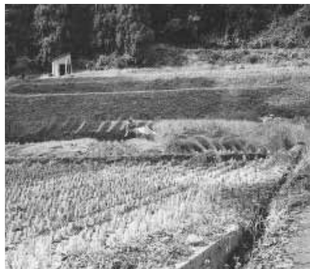
生命を守る、中山間地農業を守る

問 基本法の間接論点の評価と担い手への集中政策、本町の対応は。 町長 食料、農業、農村基本法が成立して5年が近づき目標達成できず、一気に農業構造確立を急ぐものである。中間論点整理担当の企画部会が地方公聴会を開き提言を求めている。本町提出の意見の内容は、担い手だけでなく品目の横断政策、優良農地対策等の他、多様な環境、中山間地への施策を中心としたものである。数値目標を追うばかりに農村政策を忘れ、農業政策だけになっている。